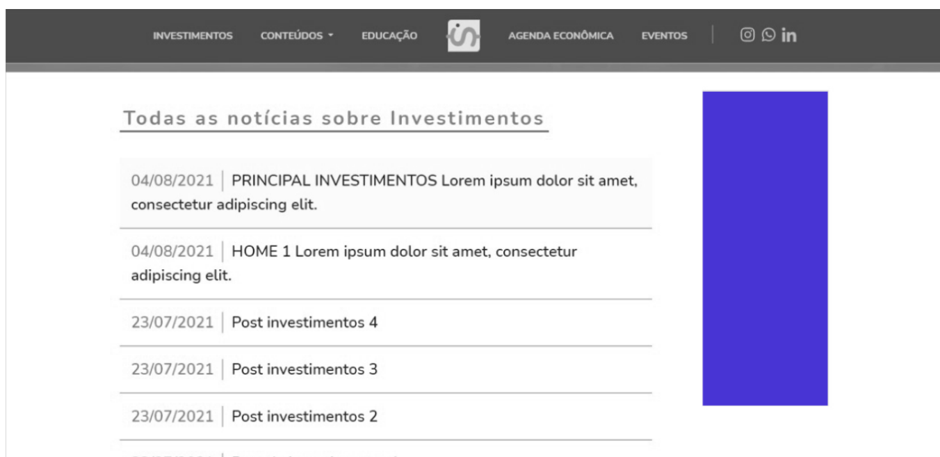
Imagem – Side 01 versão desktop. Na versão mobile, adapta-se para a disposição Body.

O portal possui 03 seções principais: Investimentos, Gestão e Inovação, e Pessoa Física. Cada seção oferece o espaço “SIDE 01”, localizado, na versão desktop, em destaque, na lateral, ao lado das notícias elencadas na categoria; e na versão mobile abaixo da notícia principal, antes do menu com todas as principais notícias da categoria.