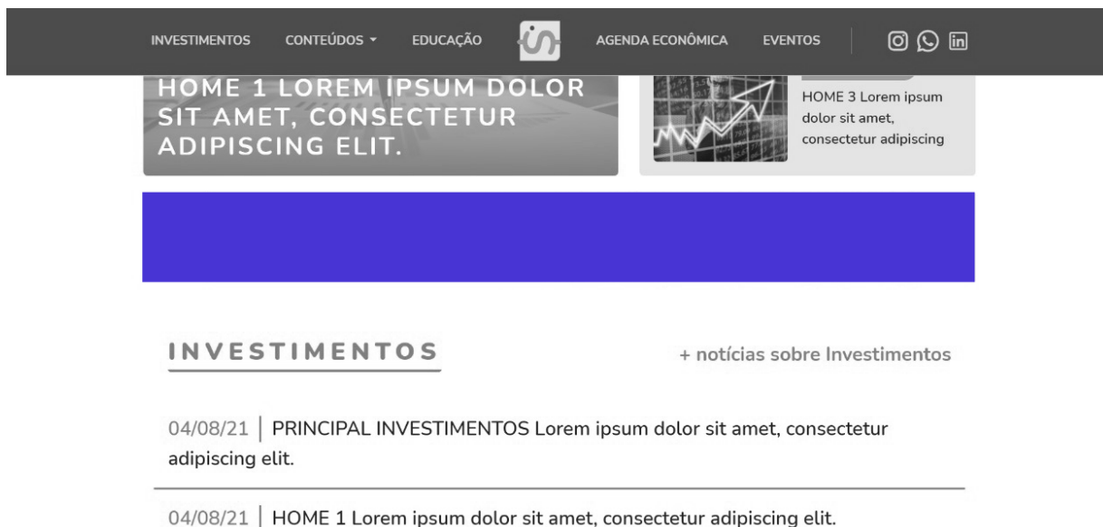
Imagem – Body versão desktop e mobile

Tem dimensão similar ao “HEAD” e é fixo na home, ou seja: oferece um ponto de contato com o usuário, não aparecendo nas demais páginas do portal.