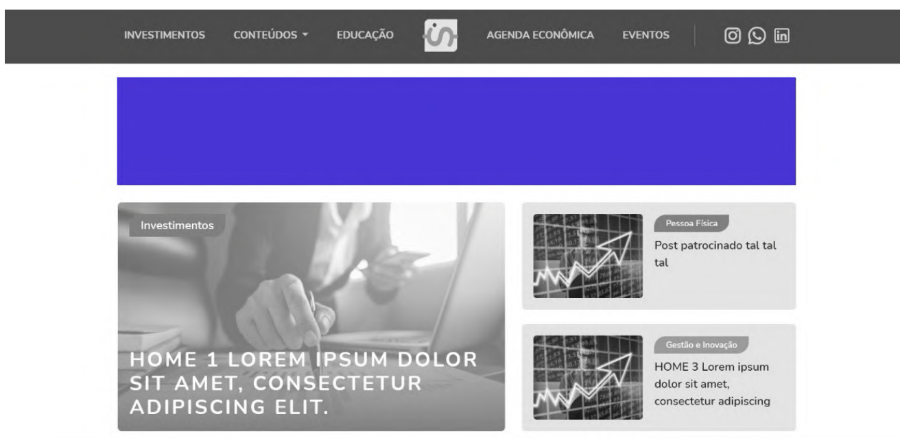
Imagem – Head versão desktop e mobile

O espaço é fixo em todo o portal, ou seja: a publicidade aparece em todas as páginas, independente da navegação do usuário, aumentando os pontos de contato entre público e marca.